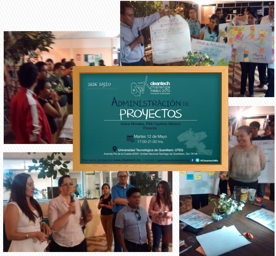
Taller para Emprendedores del CleanTech Challenge México Sede Bajío usando materiales del PMI Educational Foundation